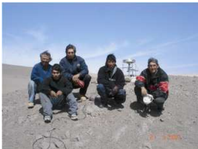
Figura 2.- Estación geodésica de ZAMA y personal del IGP